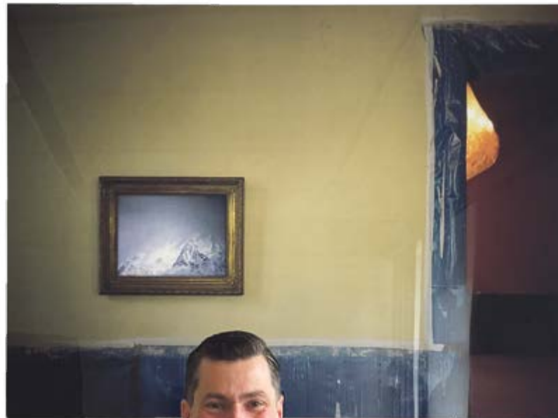
Hinter dem Schreibtisch des OB: Eine Arbeit aus der Fotoserie der Schweizer Künstlerin Leta Peer aus dem Bestand der Kunstsammlungen Augsburg.

bemerkenswertes Engagement vieler Unternehmen für Kunst und Kultur. Die Stadtparkasse Augsburg ist das beste Beispiel dafür, auch viele mittelständische Unternehmen und regionale Marken tragen ganz konkret und vielerorts dazu bei, dass künstlerische Arbeit überhaupt stattfinden kann. Ob bei Projektförderungen in der freien Szene oder Sponsoring von Festivals. Das zeigt, dass Verantwortung für das kulturelle Leben in dieser Stadt schon ernst genommen wird. Und das ist auch wichtig, denn Kunst