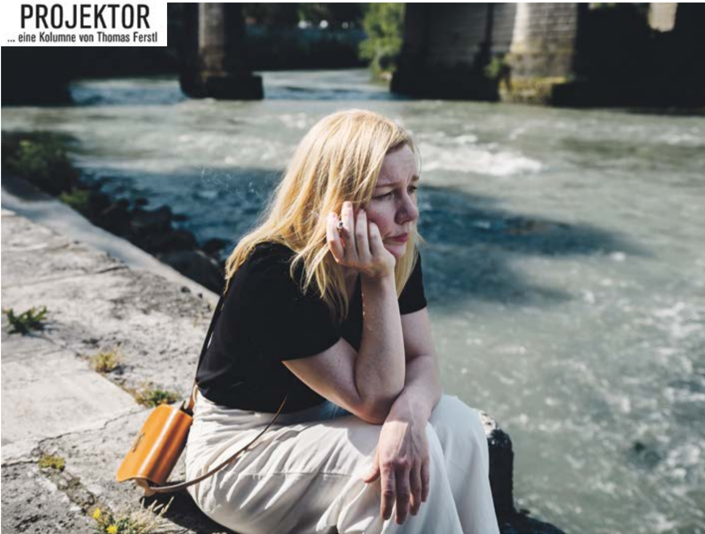
Rauchend in Rom: Sandra Hüller spielt »Ingeborg Bachmann – Jemand, der einmal, ich war«