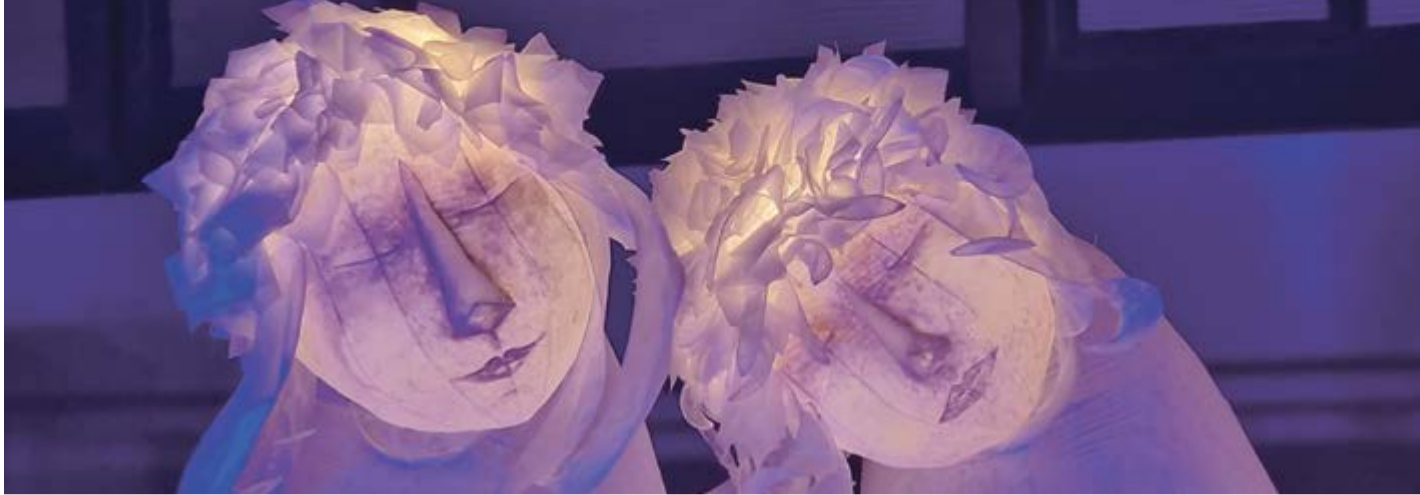
Peau d'Âme – Seelenhaut. Raumgreifendes Lichtpuppenspiel von Françoise Hueso-Chapon und Bastien Rolly (Autoren und Regie) sowie Géraldine Clément (Autorin).

Am Samstag, 20. Juni verwandelt sich Augsburgs Innenstadt erneut in eine weitläufige Kulturbühne